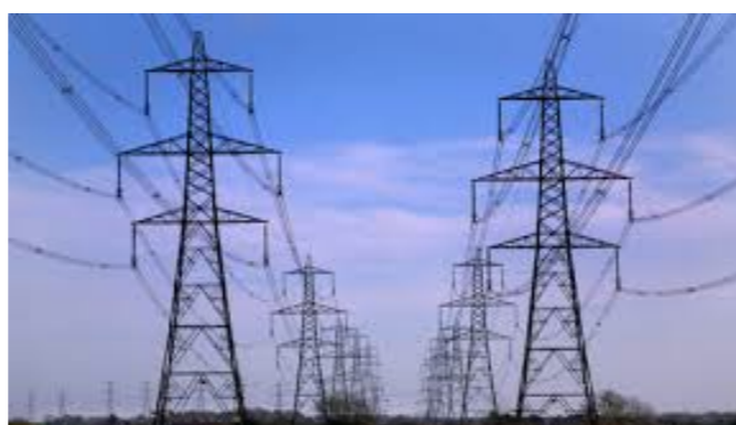
Распределение и хранение